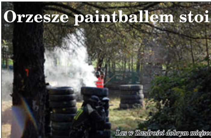
Las w Ządzrości dobrym miejscem do rozgrywek paintballa.