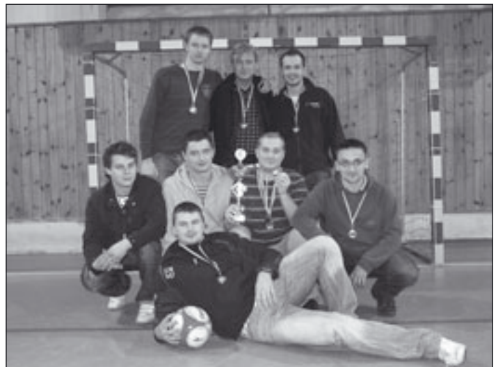
Leśne Dzbany z Górki św. Wawrzyńca