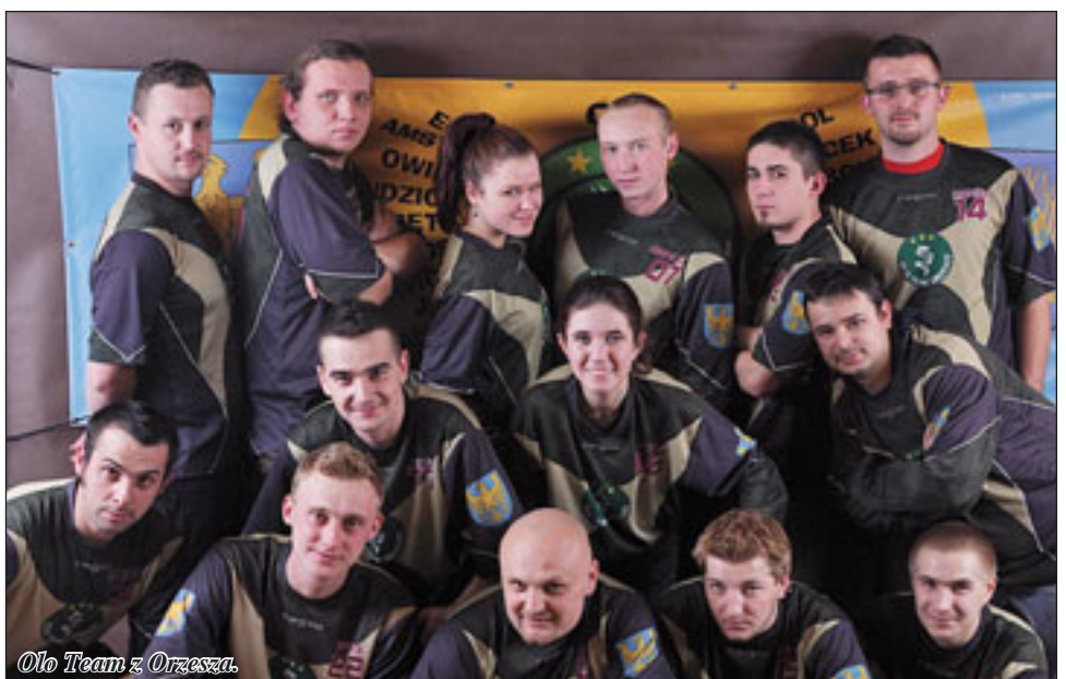
Olo Team z Orzesza.